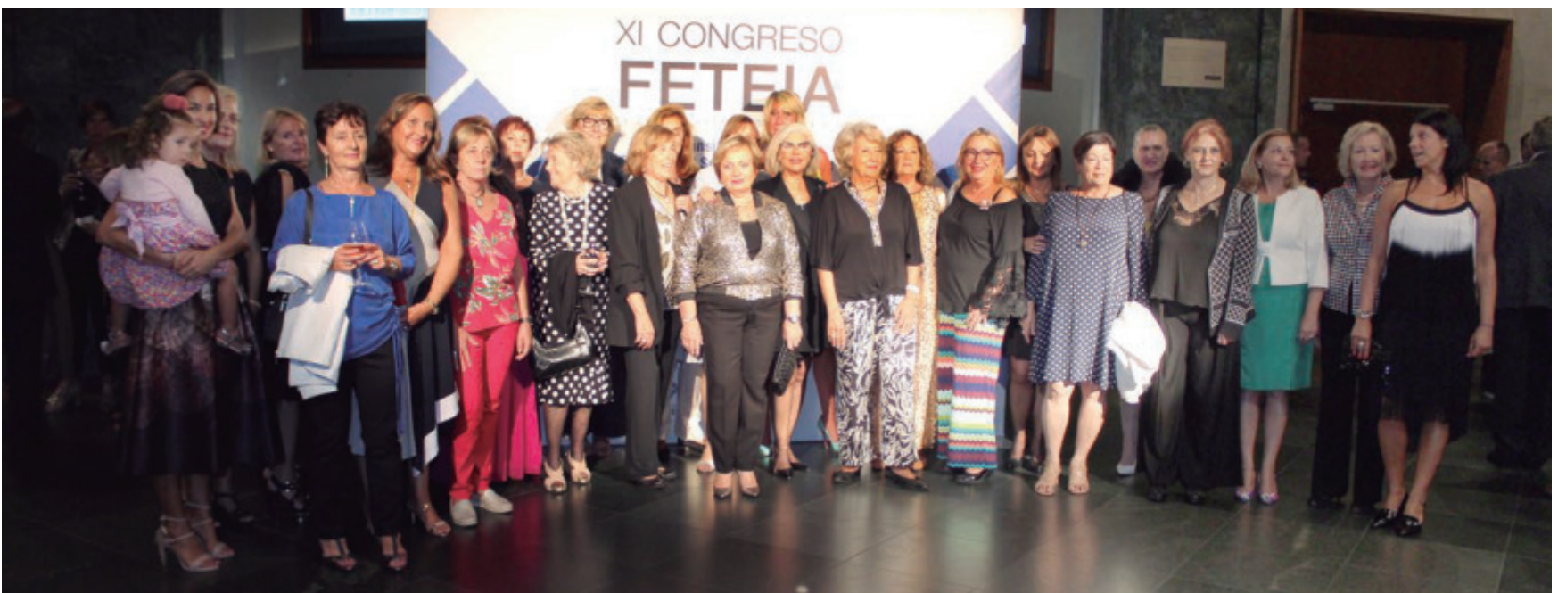
FETEIA puso en valor la presencia de las mujeres en el XI Congreso que forman parte del grupo "Transitarias de España".

La cena de clausura del XI Congreso FETEIA, que tuvo lugar en el Teatro La Laboral, contó con un espectáculo de monólogos y la participación de congresistas y familiares que se despidieron hasta el próximo Congreso en Algeciras.