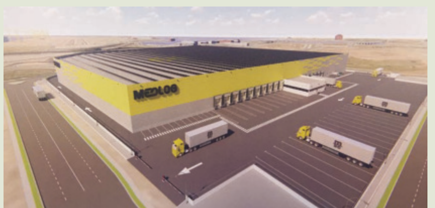
Medlog invertirá 35,7 millones en su nave para refrigerados y congelados.