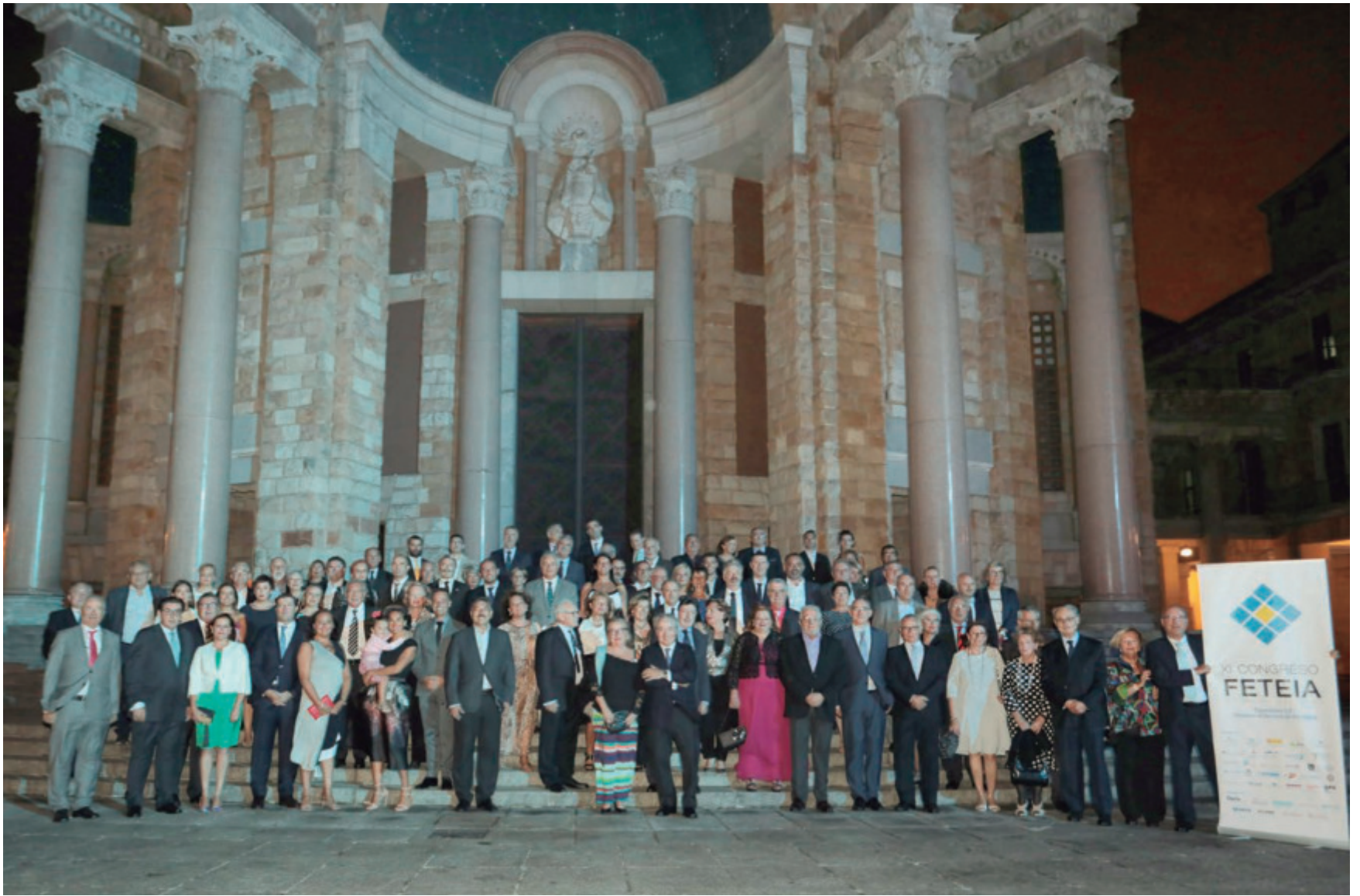
Todos los asistentes del XI Congreso de FETEIA el sábado en la cena de clausura que tuvo lugar en el Teatro La Laboral de Gijón.

LOGÍSTICA • Se hizo entrega de la bandera de FETEIA a ATEIA Algeciras, próxima anfitriona en el XII Congreso 2021