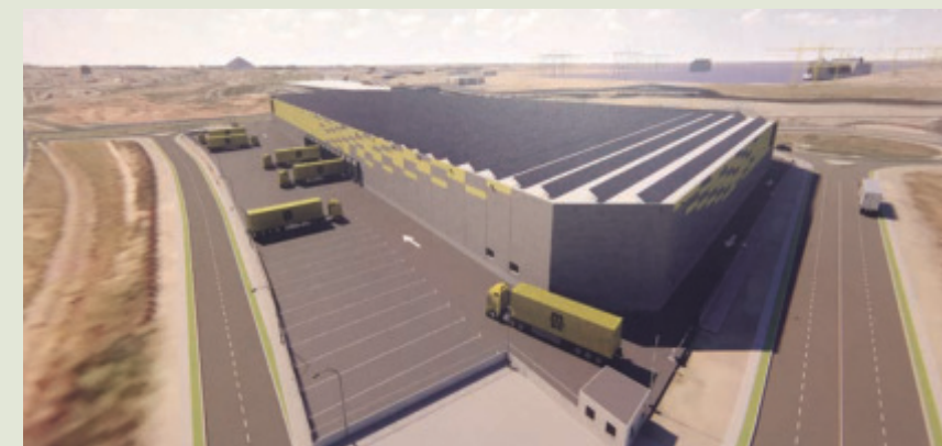
El proyecto presentado por MSC España requiere una inversión de 9,8 millones de euros.