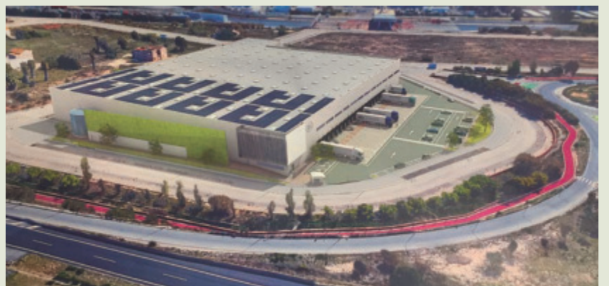
Raminatrans invertirá 9,2 millones en su proyecto de la ZAL del Puerto de Valencia.

LOGÍSTICA • Tras la apertura de los sobres con la oferta socioeconómica, se abre un periodo de tres meses para su estudio