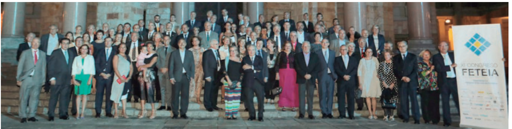
Todos los asistentes del XI Congreso de FETEIA el sábado en la cena de clausura que tuvo lugar en el Teatro La Laboral de Gijón.

Así lo han asegurado desde la Autoridad Portuaria de Barcelona (APB) tras el anuncio de la renovación de tres certificaciones de su sistema de gestión ambiental.