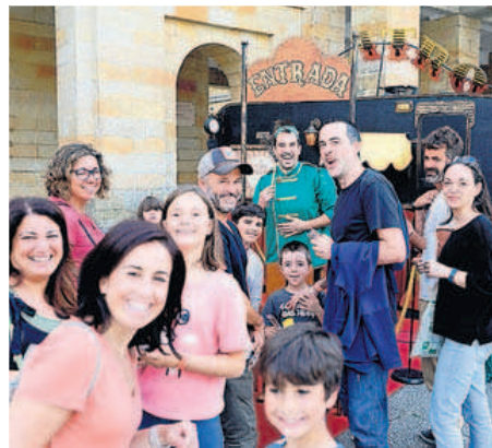
Público a la entrada de una de las caravanas.