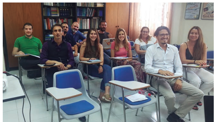
Alumnos participantes en el curso de ATEIA OLTRA Valencia de la semana pasada.

El contenido del curso incluyó formación sobre: el reglamento de la industria, el agente de carga IATA, la geografía mundial, las aeronaves, instalaciones, aceptación de la carga, procedimientos de reserva, la automatización del cargo, las tarifas y el Airwaybill.