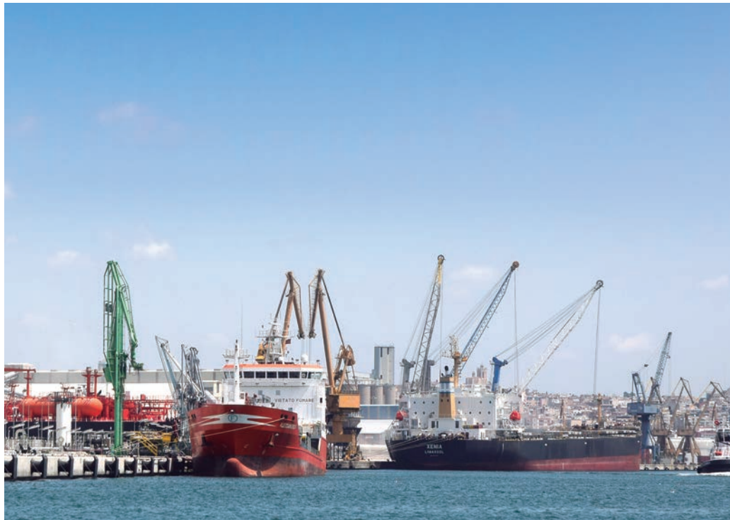
El nuevo Plan Director diseña una serie de acciones encaminadas a facilitar un desarrollo ordenado del Puerto de Tarragona.

La justificación para incorporar esta modificación reside en el hecho de que "el crecimiento real de la actividad de cruceros turísticos en el Puerto de Tarragona está mostrándose mucho más activo que lo pronosticado, lo que obliga a plantearse un escenario de creci-