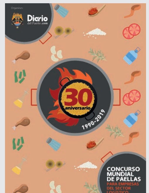
Portada del libro del 30º aniversario.