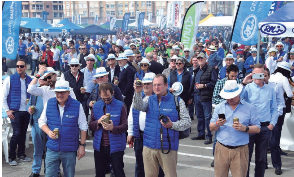
El sector logístico estará mañana pendiente del Concurso Mundial de Paellas.

El jurado del 30º Concurso Mundial de Paellas estará compuesto por 23 personas que tendrán la difícil tarea de elegir la mejor