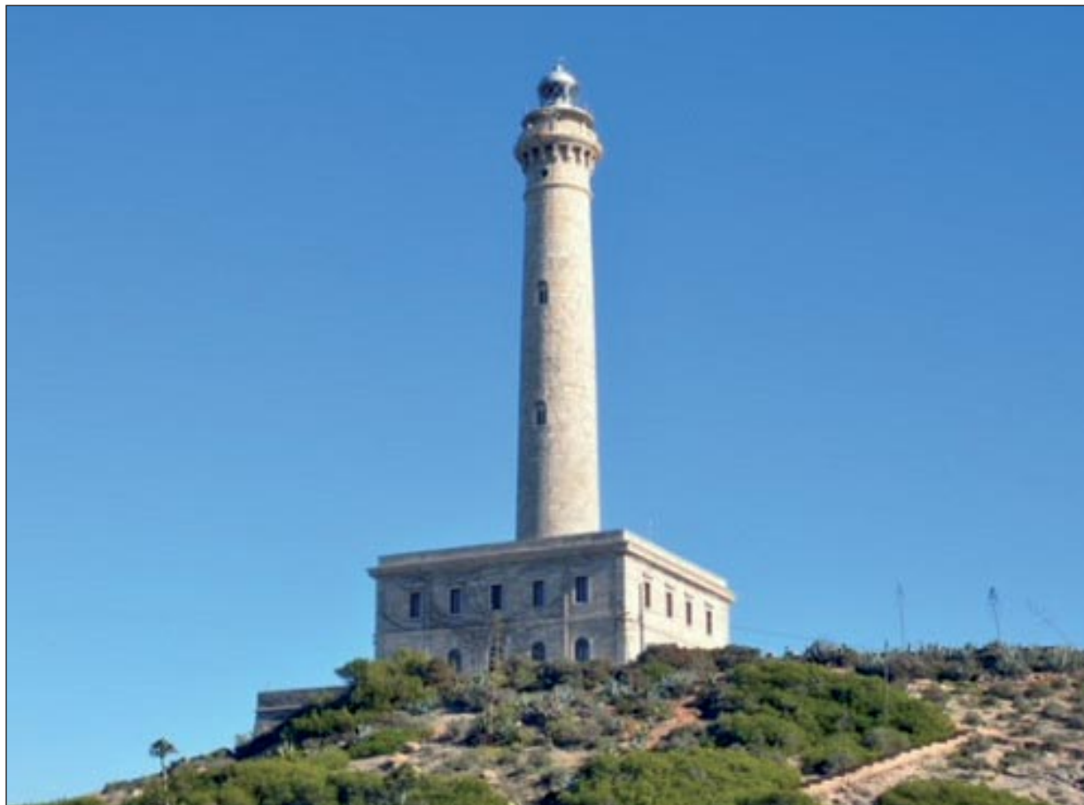
El faro está gestionado por la Autoridad Portuaria de Cartagena

construcción, se llevará a cabo por 5 empresas autorizadas por la Autoridad Portuaria de Cartagena y podrá realizarse todos los días del año para grupos de un máximo de 6 personas mayores de 16 años.