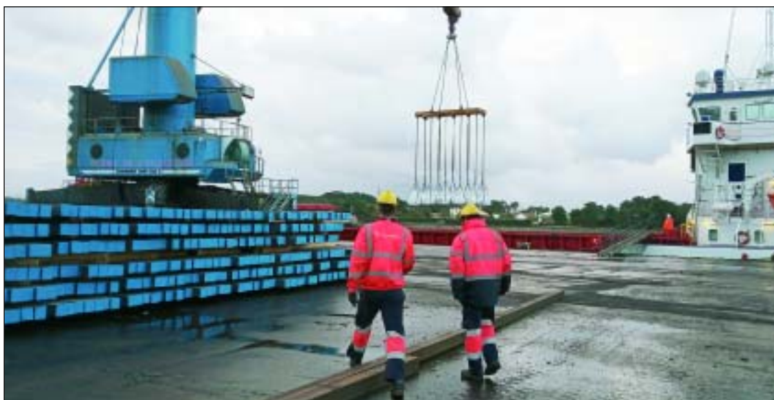
Erhardt France opera como terminal y consignataria de buques en el puerto de Baiona