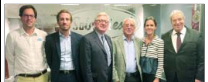
Representantes de Solé Diesel y Fenwick