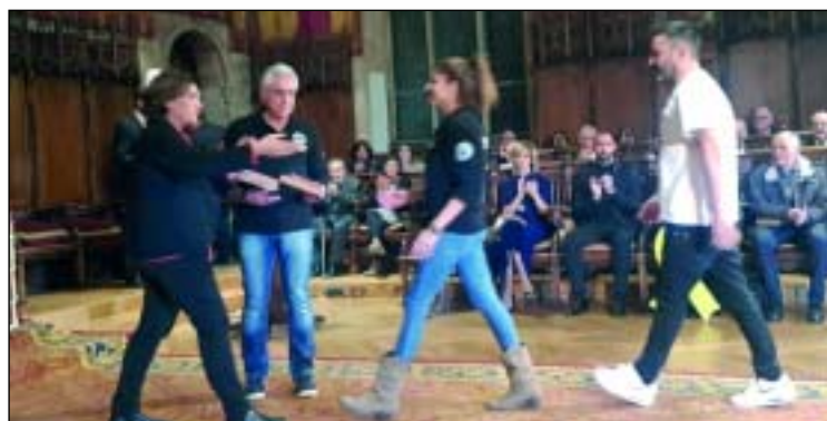
La alcaldesa Ada Colau en el momento de entrega de la Medalla de Honor 2018 a los representantes de los estibadores