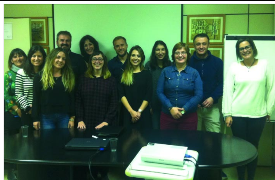
Instantánea de la clausura del curso aduanas para transitarios, organizado por ATEIA-Madrid