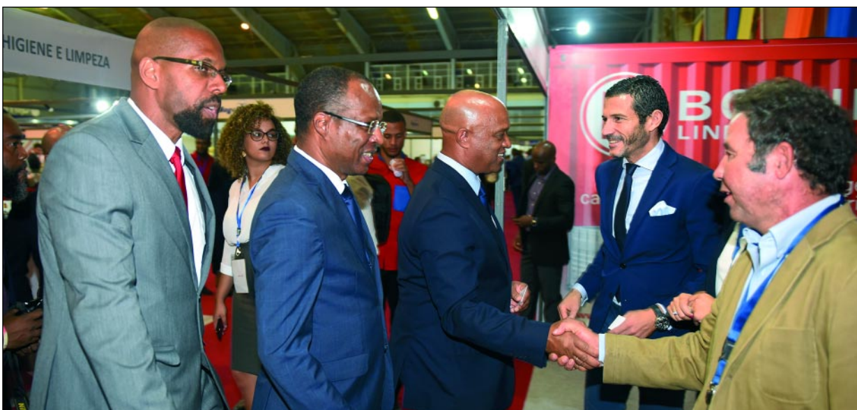
El stande Boluda recibió las primeras autoridades de Cabo Verde