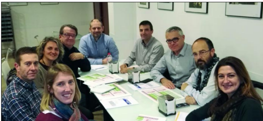
El claustro de profesores prepara nuevas ediciones del curso de representante aduanero

La Fundación del Puerto de Valencia ya está preparando para el próximo año la 6ª y 7ª edición del curso teórico de representante aduanero, así como el curso práctico que ayudará a los que se examinen en el 2019. Así se anunció tras la reunión de parte del claustro de profesores que imparten la formación vinculada a estos cursos celebrada el 22 de noviembre.