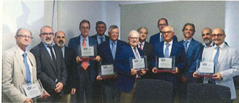
Asociados y empresas recibieron una placa en conmemoración de estos veinte años de actividad de la sociedad

En el transcurso del Consejo de Administración se entregó una placa conmemorativa a los colaboradores