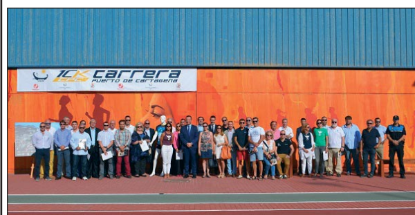
Representantes de la organización de la carrera

naves multiusos. Asimismo, dispondrá de doce grúas pórtico, ocho Súper Post-Panamax, cuatro Panamax y un patio de contenedores que podrá satisfacer la demanda de almacenamiento de los puertos adyacentes.