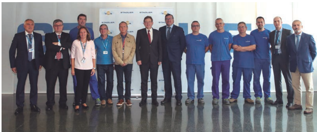
El presidente de la Generalitat, Ximo Puig, durante su visita a Stadler Rail Valencia.

mismo, el gerente subraya que este mismo año se han posicionado como los distribuidores número 1 en España y Portugal y número 5 es Europa.