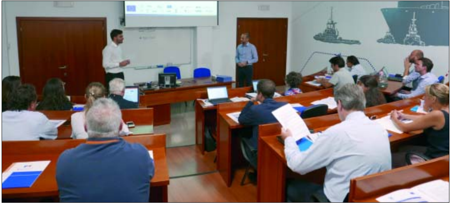
La reunión analizó las tecnologías y soluciones que se pueden implementar en el puerto de Valencia

Una de ellas es la creación de una incubadora de innovación para fomentar la colaboración entre comunidad portuaria, pymes locales y start-ups. Las otras dos están relacionadas con la implementación de un sis-