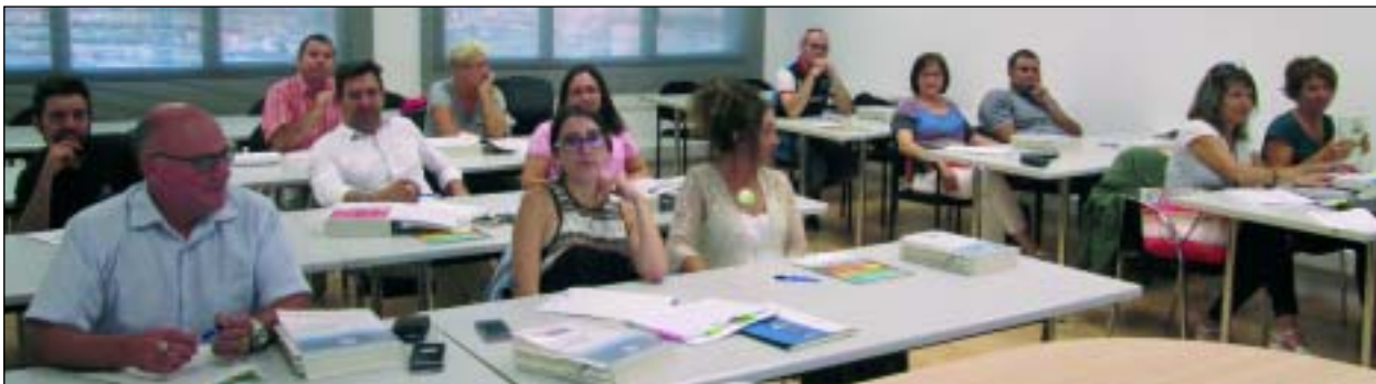
El martes se inauguró un nuevo curso de reciclaje para el transporte aéreo de mercancías peligrosas

La Asociación de Transitarios de Barcelona (ATEIA-OLTRA) inauguró el martes 25 de septiembre un nuevo curso de reciclaje para el transporte aéreo de mercancías peligrosas, homologada por IATA. Destacar que ATEIA