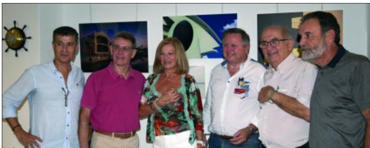
Los asociados con más de 25 años en activo recibieron la insignia de plata