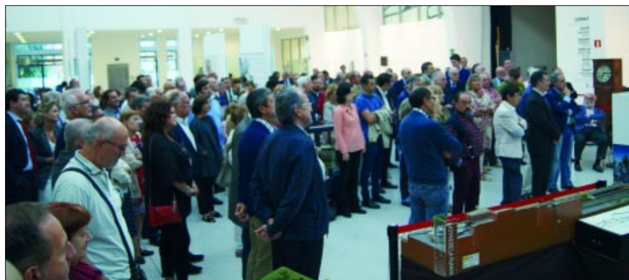
Más de dos centenares de personas acudieron a la llamada de la Asociación de Amigos del Ferrocarril de Bilbao (AAFB)

ción referida a la presencia del tren en Bilbao.