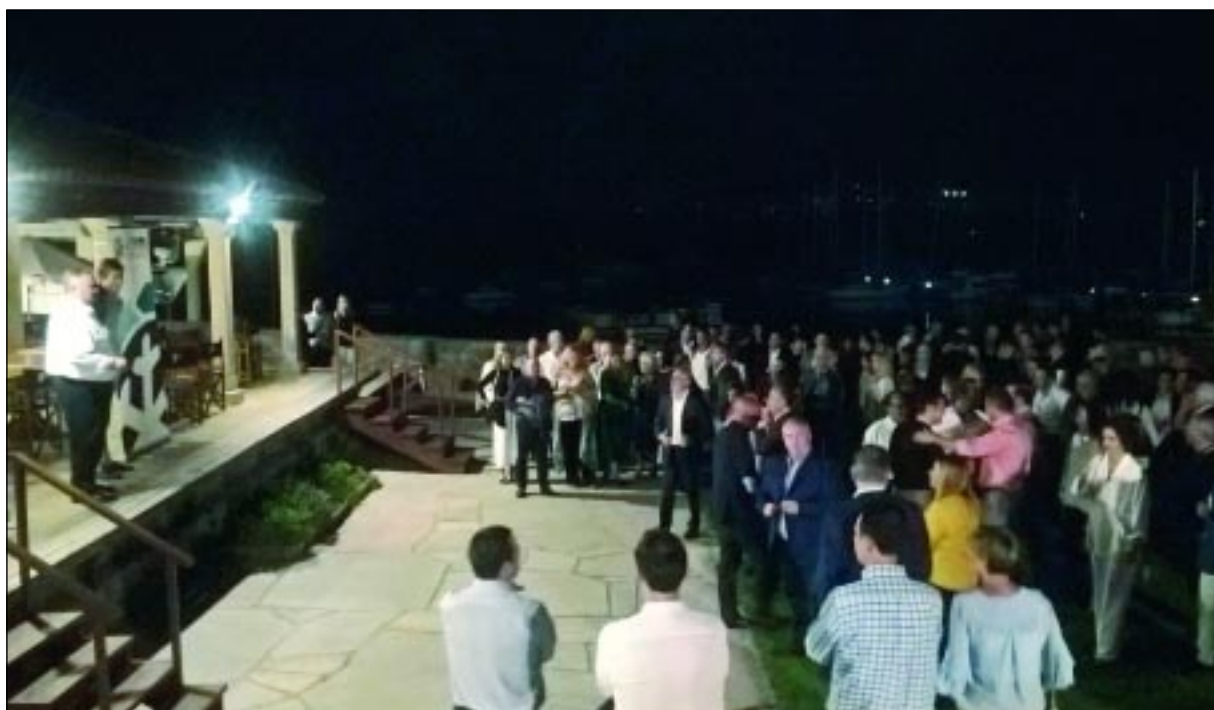
El encuentro tuvo lugar en Baiona (Pontevedera)

Muchos eran los motivos por los que hubo tanta expectación, ya que internamente se modificaban sus estatutos asociativos, y a nivel sector se presentaba el estado actual del proceso, de los acuerdos con la parte sindical, hacia la creación de un convenio colectivo de sector.