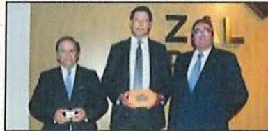
40 años: Cosmopartner, S.A. (antes Novocargo), y Ership, S.A.

En la celebración de la 12 edición del Día del Transitario se concedieron las distinciones a las empresas vinculada a ATEIA Barcelona hace 40, 30, 20 y 10 años: