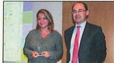
10 años: Road Cargo, S.L., y Fill Cargo, S.L.