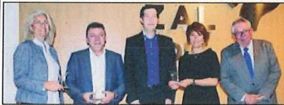
30 años: Space Cargo Services, S.A., Delta Transitarios, S.A.- Deltransa, Airpharm, S.A., y Panalpina Transportes Mundiales, S.A.