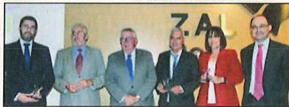
20 años: Asta Logistik, S.L., Legend Forwarding Group, S.L., Cargo Services Barcelona, S.A., Mat Cargo, S.A., Liberty Cargo, S.L., y Roehlig España, S.L.